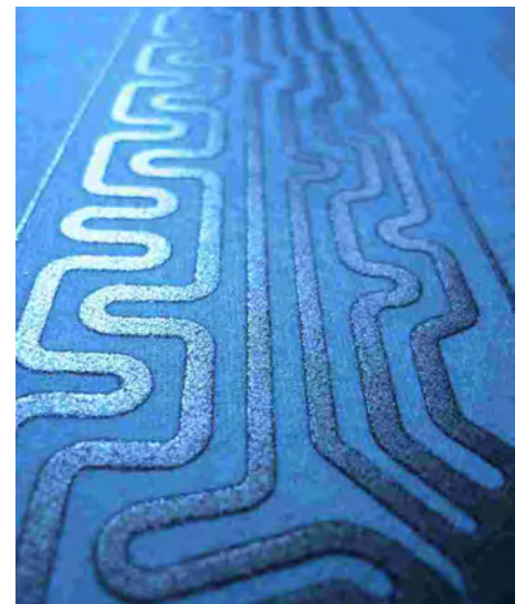
Freudenberg Forschungsdienste KG: dehnbare Leitpaste für Heizanwendungen auf evolon® Vliesstoff

Robert Schwetz Mehler Technologies GmbH, Hückelhoven