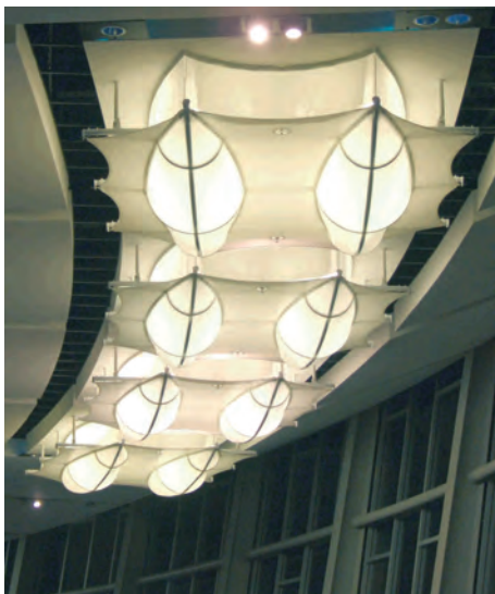
Lichtobjekte „Vector Arena“, mit Textilien von Mehler Technologies GmbH, © Structurflex

Das Konzept eines Gemeinschaftsstands in der "Innovations- und Entwicklungshalle" hat sich bewährt. Wir konnten unsere Kontakte zu Materialforschungs- und Prüfungsinstituten pflegen und ausbauen.