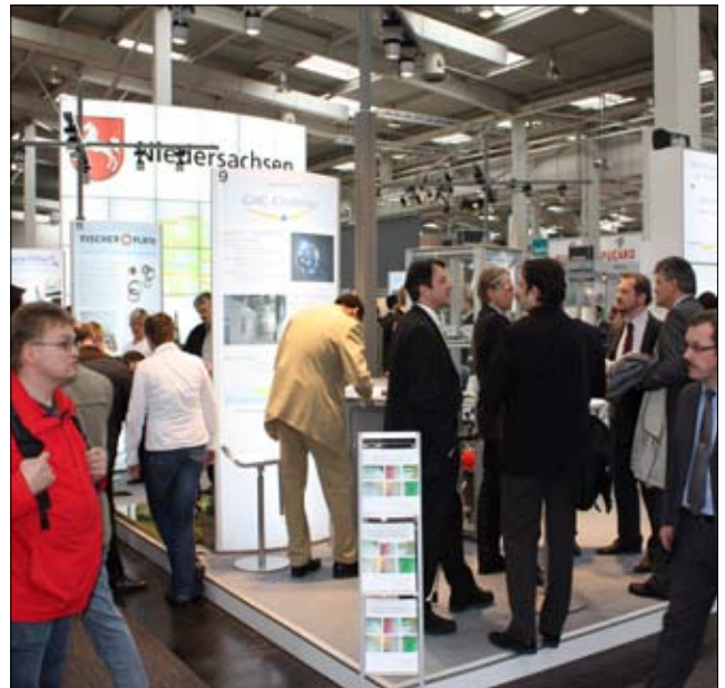
Gemeinschaftsstand HANNOVER MESSE 2010